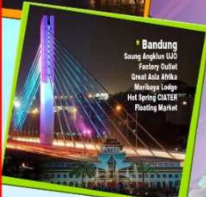
Bandung Saung Angklun UJO Factory Outlet Great Asia Ahika Maribaya Lodge Hot Spring CIATER Floating Market