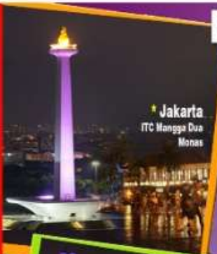
Jakarta ITC Mangga Dua Monas