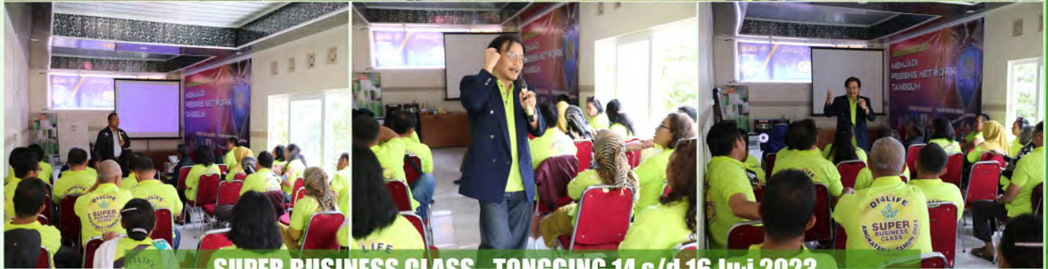
SUPER BUSINESS CLASS - TONGGING 14 s/d 16 Juli 2023