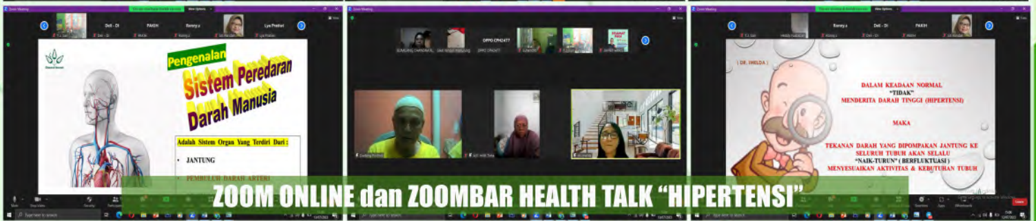
ZOOM ONLINE dan ZOOMBAR HEALTH TALK "HIPERTENSI"