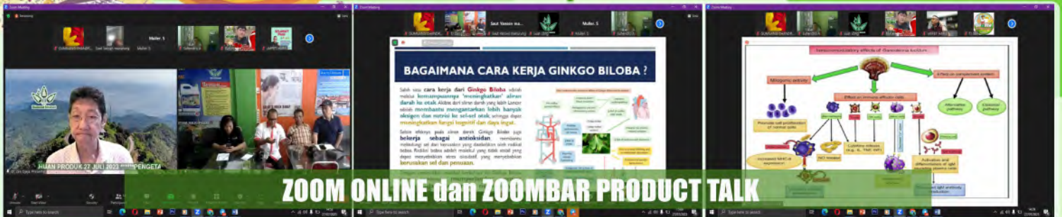
ZOOM ONLINE dan ZOOMBAR PRODUCT TALK